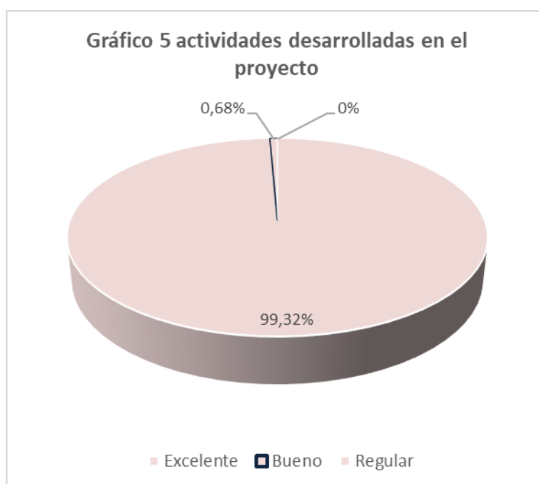
Gráfico N°5. Resultados Tabulados de la Pregunta 5

Análisis: del 100% de los encuestados de la Unidad Educativa Génesis, el 99.32% correspondiente a 146 alumnos, refiere que es excelente las actividades desarrolladas en el proyecto, mientras el 0.68% correspondiente a 1 alumno nos dice que las actividades realizadas son buenas.