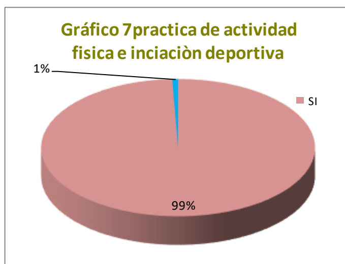
Gráfico N°7. Resultados Tabulados de la Pregunta 7.

Análisis: Del 100% de los encuestados de los beneficiarios del proyecto, el 99% correspondiente a 146 personas afirman que la práctica de actividad física si motiva a realizar una iniciación deportiva, mientras que el 1% correspondiente a 1 persona mencionó que la práctica de Actividad física no motiva a realizar una iniciación deportiva.