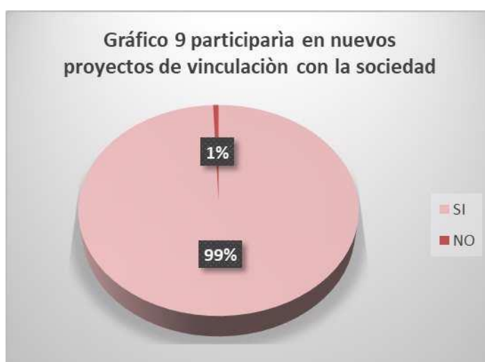
Gráfico N°9. Resultados Tabulados de la Pregunta 9

Análisis: Del 100% de los encuestados de la Unidad Educativa Génesis, el 100% correspondiente a 147 estudiantes, manifiestan que en un futuro participarían en nuevos proyectos de vinculación con la sociedad desarrollados por la UTA.