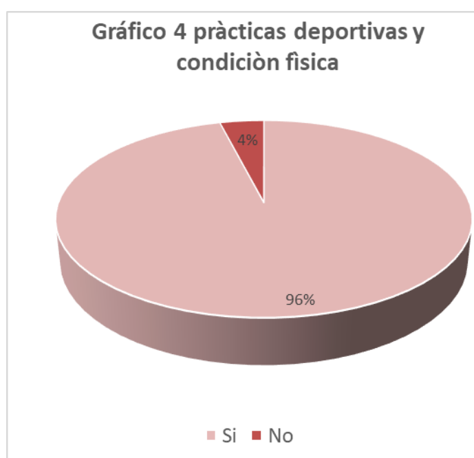
Gráfico N°4. Resultados Tabulados de la Pregunta 4

Análisis: Del 100% de los encuestados de la Unidad Educativa Génesis, el 96% correspondiente a 146 estudiantes afirman que la práctica de las diferentes actividades deportivas si mejoró su condición física, mientras que el 1%, correspondiente a 1 estudiante, afirma que la práctica de diferentes actividades deportivas no mejoró su condición física.