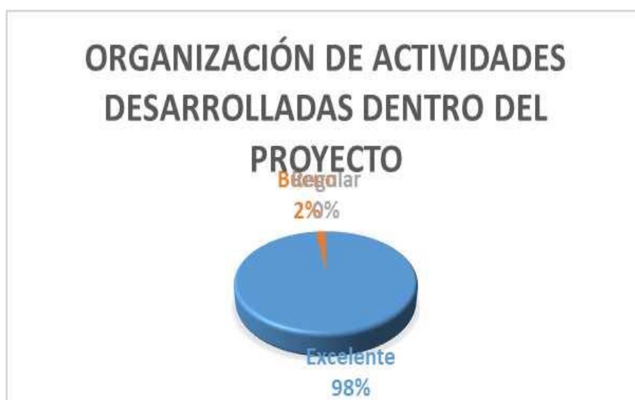
Gráfico N°2. Resultados Tabulados de la Pregunta 2

Análisis: Del 100% de los encuestados de la Unidad Educativa Génesis, el 98% correspondiente a 144 estudiantes, manifiestan que la organización de actividades desarrolladas dentro del proyecto fue excelente; mientras que el 2 %, es decir 3 encuestados, afirman que fue buena; y el 0%, correspondiente a 0 estudiantes, considera que fue regular.