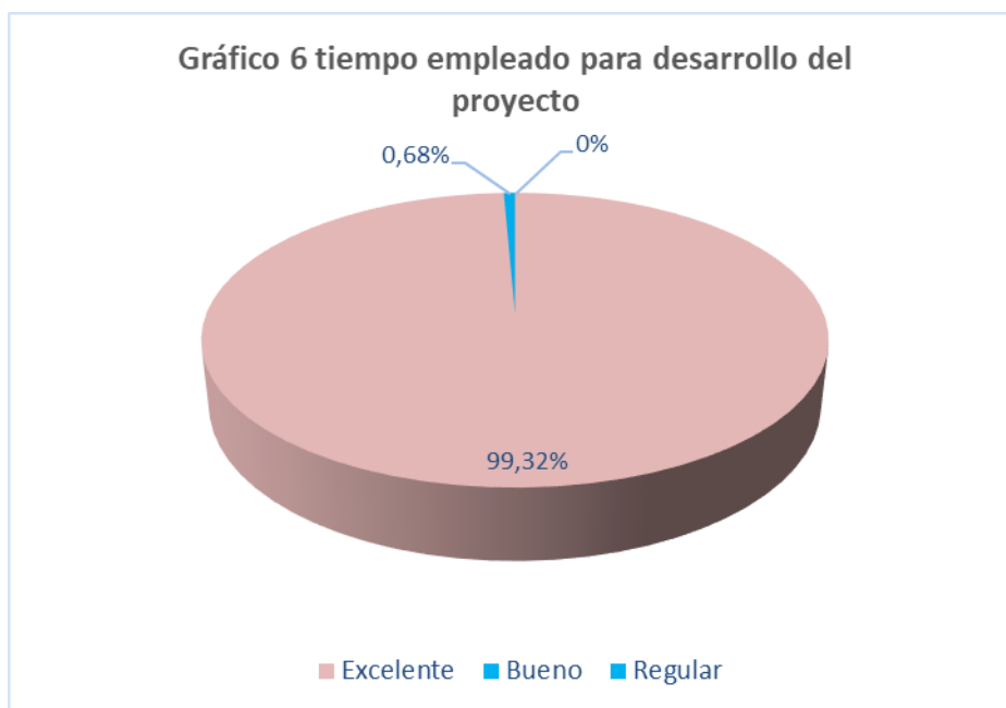
Gráfico N°6. Resultados Tabulados de la Pregunta 6.

Análisis: del 100% de los encuestados de la Unidad Educativa Génesis, el 99.32% correspondiente a 146 alumnos, expresa que el tiempo empleado para las actividades es excelente, mientras el 0.68% correspondiente a 1 alumno nos dice que las horas empleadas son buenas.